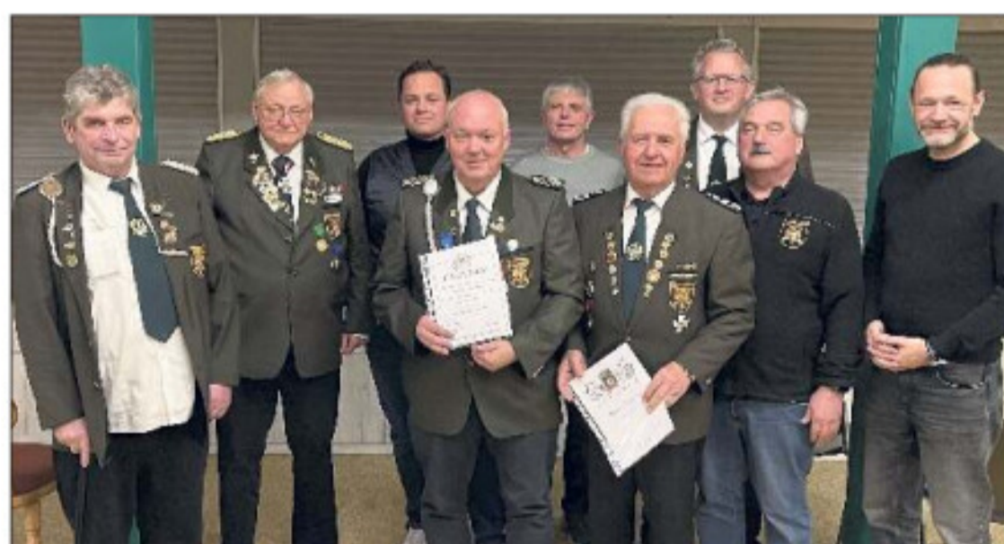
Die Geehrten der Schützengilde Reutlingen.

ren zwischen 21 und 77 Jahren sowie Freie Theatergruppen unter den Namen Tacklack, Theater. Aus Gründen, L.I.E.B. und WanDelbar. (nol)